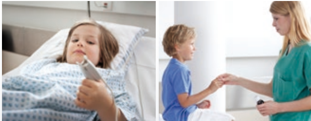
Zuwendung und Verantwortung im Umgang mit Kindern